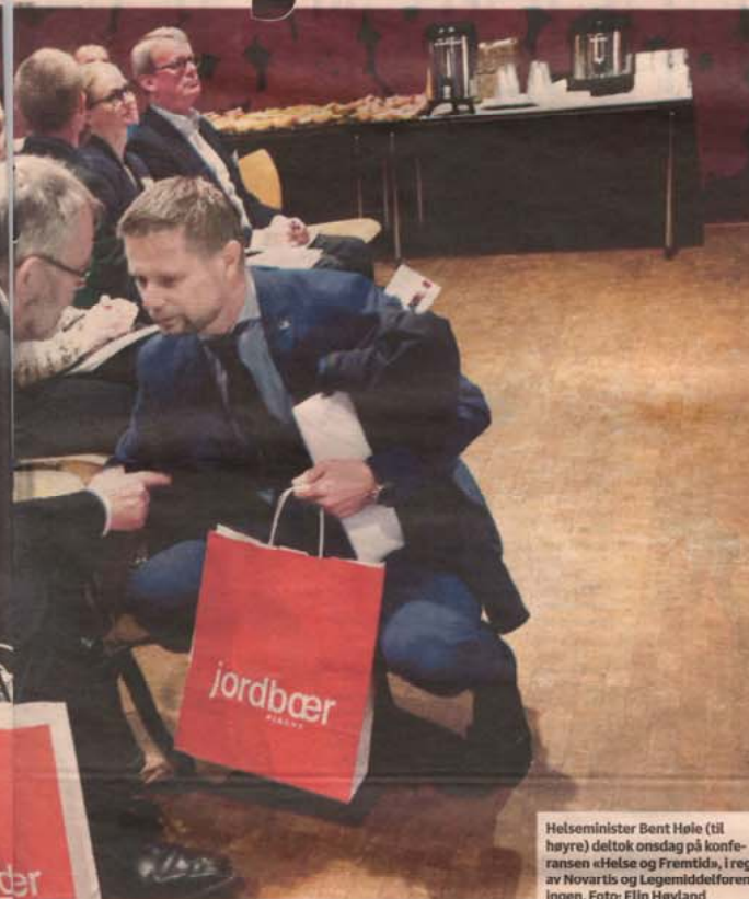
Helseminister Bent Høie (til høyre) deltok onsdag på konferansen «Helse og Fremtid», i regi av Novartis og Legemiddelforeningen.